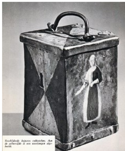
Beeldhouwde Japans cultuur. Aan de achterzijde is een wettige afbeelding.

Proveniers, mensen die zich voor een eenmalig bedrag inkochten en vervolgens levenslang 'gratis' kost en inwoning genoten, betaalden van fl. 750 voor een 40-jarige tot fl. 400 voor iemand van 70 jaar en ouder. Na 1746 werd dat fl. 1000 tot fl. 420. Behalve in het huis konden ze ook kiezen voor verzorging in een huisje op het naastgelegen terrein. Personen van buiten de stad betaalden aanzienlijk meer. Aan de vader en moeder moesten de proveniers bij hun intrede een rijksdaalder geven, aan de keukenmeid een halve dukaat en aan de knaap ook een halve dukaat. Ook moest ieder een bed, dekens, lakens, slopen, een stoel, een waterpot, bedgordijnen, voldoende onder- en bovenkleren, kousen, schoenen en eetgerei meebrengen. Na hun overlijden werden die eigendom van het huis. 's Middags en 's avonds aten de proveniers na het luiden van de bel aan een gemeenschappelijke tafel. Als ieder klaar was las de meester een tukje uit de bijbel voor, gevolgd door het dankgebed en het zingen van een psalm. 's Avonds om negen uur ging de voordeur op slot en werd de sleutel aan de vader in bewaring gegeven. Zonder zijn toestemming kon dan niemand meer het gebouw in of uit.