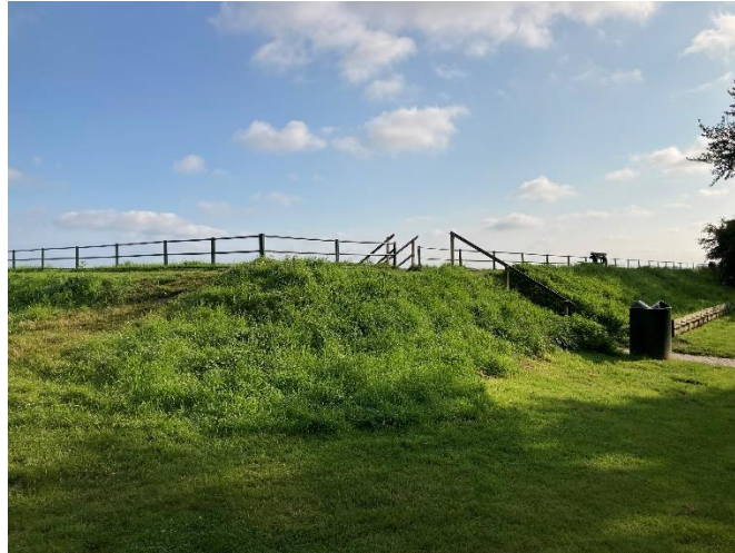
Mogelijke plaats voor een 'opril'.

Het zou wenselijk zijn om op deze plek een hellingbaan te maken zodat mensen met een rolstoel ook op het pad kunnen komen. Dergelijke opritten waren overigens in de tijd dat Veere nog een vesting was heel gewoon. Ze heten een 'opril'. We denken dat van een dergelijke opril veel mensen plezier kunnen hebben. Zowel rolstoel gebruikers als gezinnen met kleine kinderen in wandelwagens en mensen die slecht ter been zijn met een rollator.