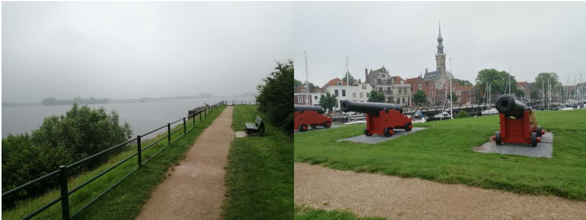
Het pad op een grijze dag en de kanonnen op het Noorderhoofd

Een van de mooiste punten in Veere is het pad boven de zeemuren benoorden de haven. Van de Stenen Beer tot het Noorderhoofd loopt een pad met een prachtig uitzicht over het Veerse Meer.