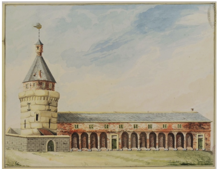
Montfoortse Toren in Veere (1502-1829), onderdeel van de zeemuur en gebruikt als gevangenis